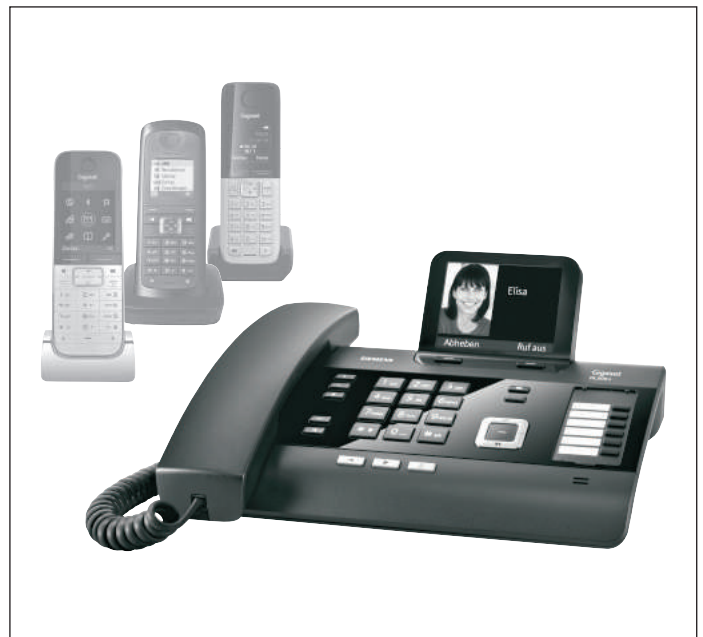
Mobilteile nicht im Lieferumfang enthalten